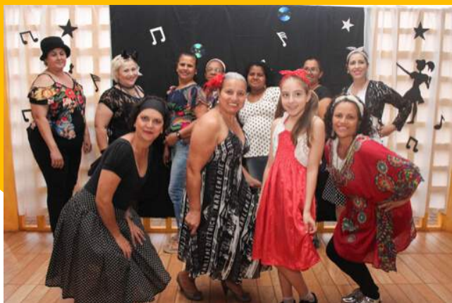
O Baile Anos 60, 70 e 80 teve dança, trajés típicos e muita animação.