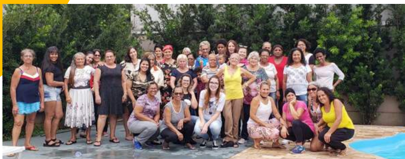
Confraternização de início de ano do grupo Sócioeducativo.

Na tradicional Festa Junina, assistidos, voluntários e equipe se divertiram dançando a quadrilha.