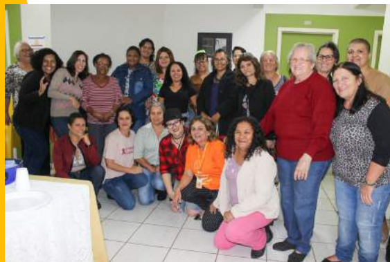
Café da tarde do Dia das Mães.

São ações e eventos realizados pela equipe técnica com o apoio fundamental dos voluntários, que sempre fazem questão de estar presentes nesses momentos.