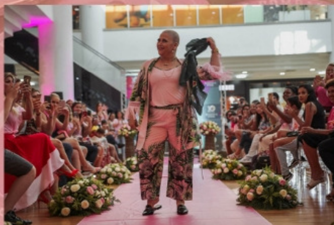
Evento 'Desfilando a autoestima', no shopping Maringá Park