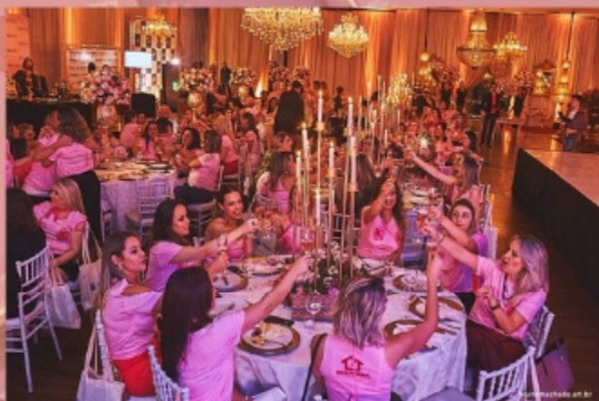
Jantar Power Pink se consolidou como um dos grandes eventos da agenda social maringense

pessoas diretamente impactadas pelas ações de conscientização